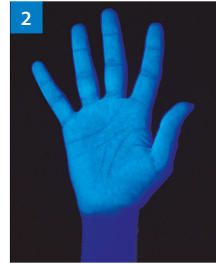
Abb. 2: Gleichmäßig helle Oberfläche – so ist es richtig!

Es ist deutlich zu erkennen, dass die Partien, z. B. an Daumen und Fingerkuppen, dunkel gefärbt sind. Hier weist die Benetzung deutliche Lücken auf.